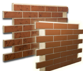
Панели с клинкерной плиткой