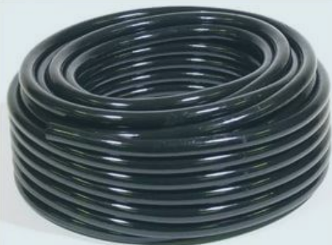
ТРУБА ПНД техническая водопроводная