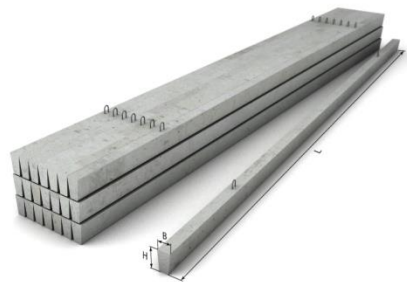
СТОЙКИ Ж/Б СТОЙКИ МЕТАЛЛ