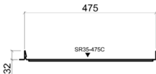
Вид фронтального разреза