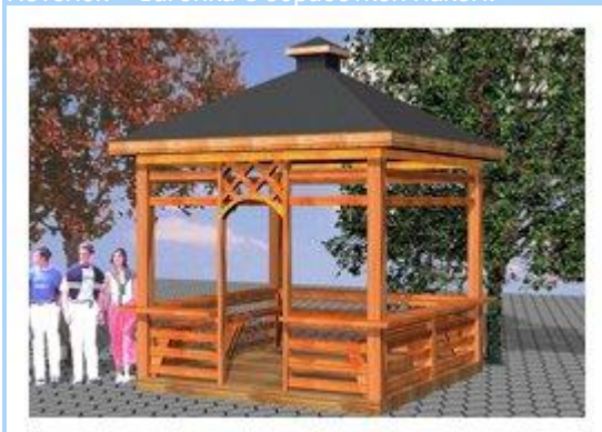
Беседка квадратная открытая

Беседка прямоугольная 2,8х5 м. Выполнена из бруса 150х150, доски обрезной 50х100, 50х150 с обработкой пинотексом. Кровля шатровая с декоративным элементом. Покрытие – металлочерепица. По периметру беседки расположены лавочки и в центре – стол. Все элементы пропитаны антисептиком и обработаны лаком. Пол – доска половая. Потолок – вагонка с обработкой лаком.