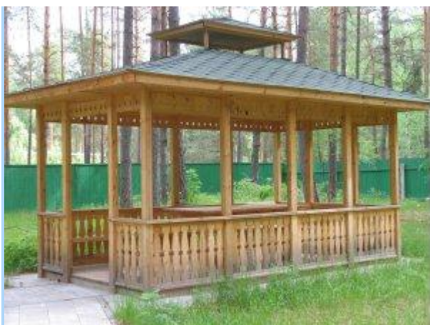
Беседка прямоугольная открытая

Беседка прямоугольная 2,8х5 м. Выполнена из бруса 150х150, доски обрезной 50х100, 50х150 с обработкой пинотексом. Кровля шатровая с декоративным элементом. Покрытие – металлочерепица. По периметру беседки расположены лавочки и в центре – стол. Все элементы пропитаны антисептиком и обработаны лаком. Пол – доска половая. Потолок – вагонка с обработкой лаком.