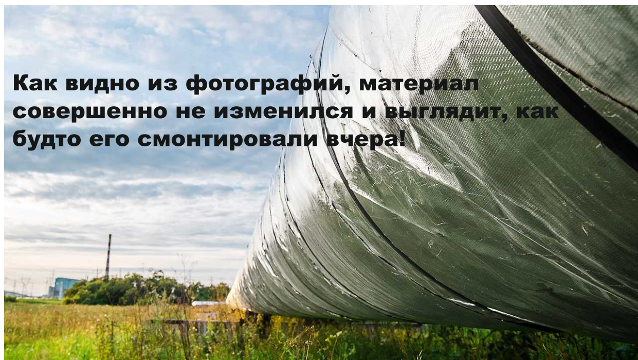
Фото и отзывы говорят сами за себя!

Отзывы были написаны в 2015 году! Но материал фотографировали в августе 2016г!