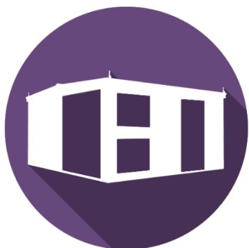
2БКТП 630 «Ретро»

Позволят сэкономить время на составлении схемы и ожидании поставки!